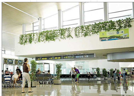
Galmés cuestiona la idoneidad de las grandes infraestructuras.

Ante esto, el científico asegura que «queda un trabajo apasionante por hacer», y anima a implementar políticas de planificación y gestión transversales, basadas en el conocimiento que se genere del medio y que sirvan para identificar Menorca como isla sostenible. La toma de decisiones debería fundamentarse en la participación de la sociedad menorquina y en la información disponible desde el rigor técnico y científico. En este sentido, «el Obsam y el IME están realizando un trabajo extraordinario