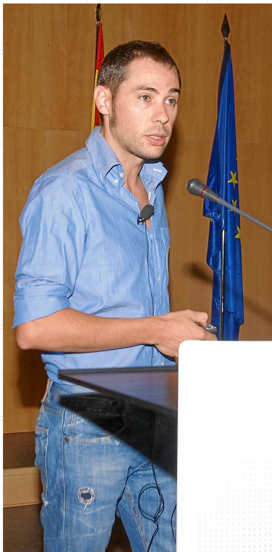
Está pendiente de la Reserva de la Biosfera de Menorca desde 2012.

En cuanto a las administraciones, las apreciaciones realizadas por el doctor Galmés apuntan especialmente al Govern balear, ya que entiende que continúa sin desarrollar políticas diferenciadas para atender la singularidad que para Menorca supone ser Reserva de la Biosfera. El científico afirma que es «una deficiencia estructural, rei-